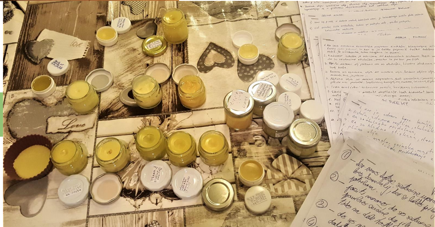
Praktični preizkus znanja