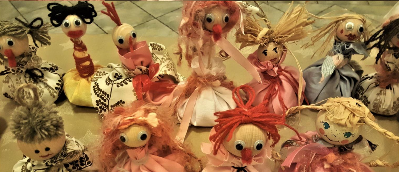
Filcanje, izdelava punčk in torbic