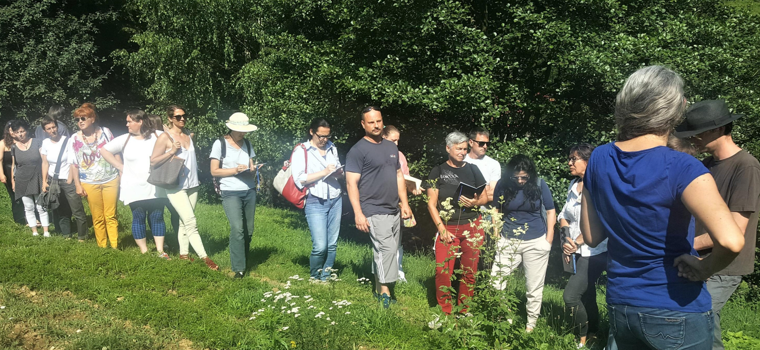
Obisk prve izdelovalke certificirane kozmetike v Sloveniji