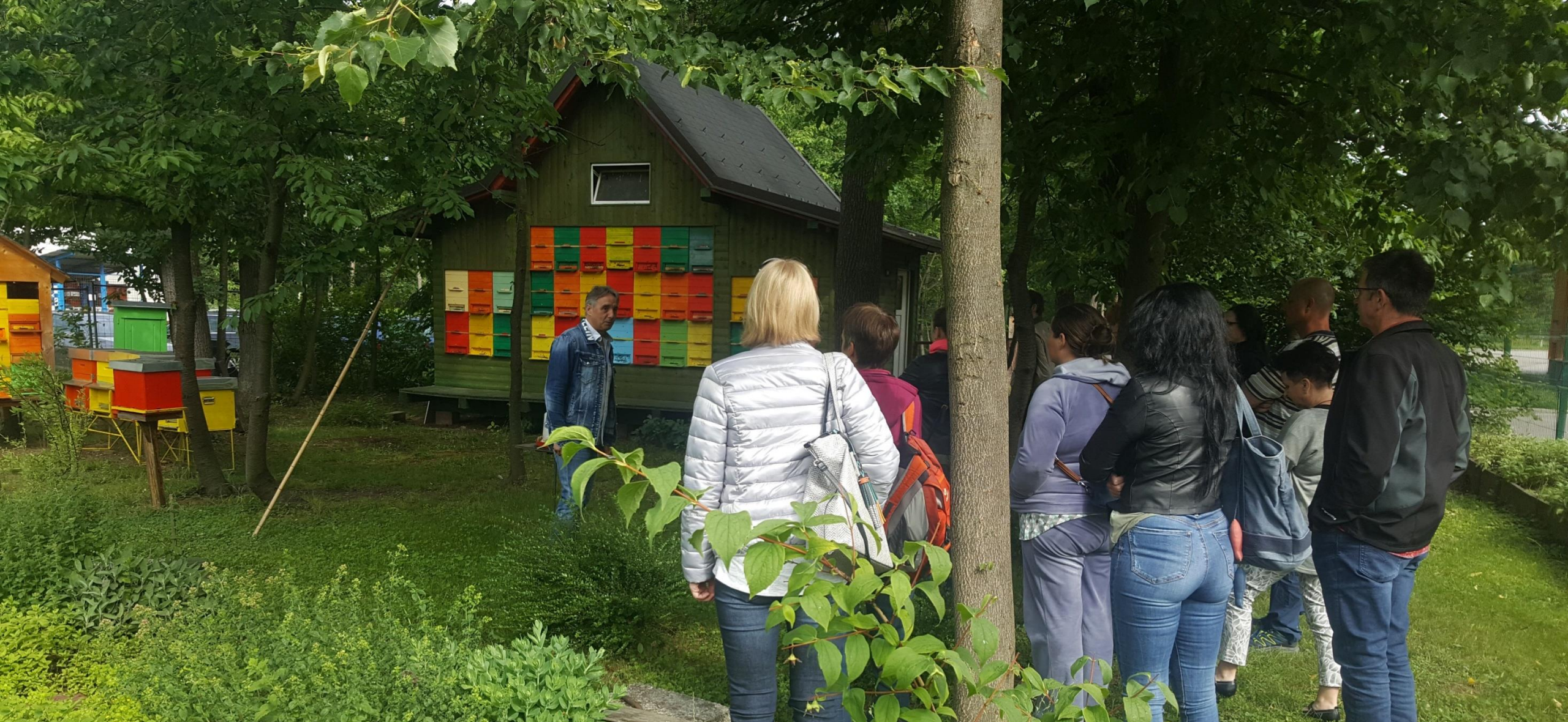
Obisk pri čebelarju