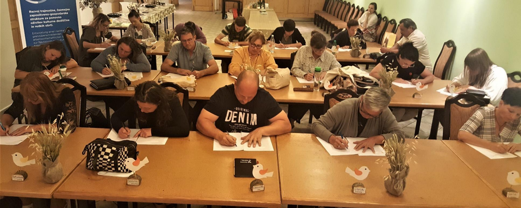
Pisni preizkus znanja